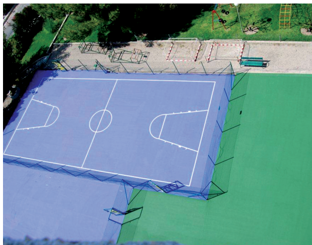
SISTEM VISOKIH PERFORMANSI NA ASFALTNIM PODLOGAMA

Sikafloor® MultiCoat sistemi specijalno su kreirani da izdrže značajnu mehaničku abraziju i habanje, kao i povremeno izlivanje hemikalija, kao što su na primer oni za automobile ili čišćenje (benzin, ulja, razređivači, industrijski deterdženti, itd.). Ovakva otpornost i izdržljivost takođe čine sisteme idealnim za postrojenja koja zahtevaju malo održavanja.