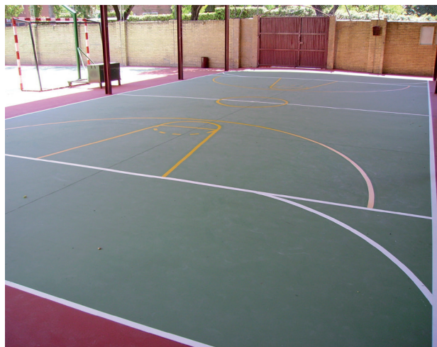
SISTEM VISOKIH PERFORMANSI NA PODLOGAMA NA BAZI CEMENTA